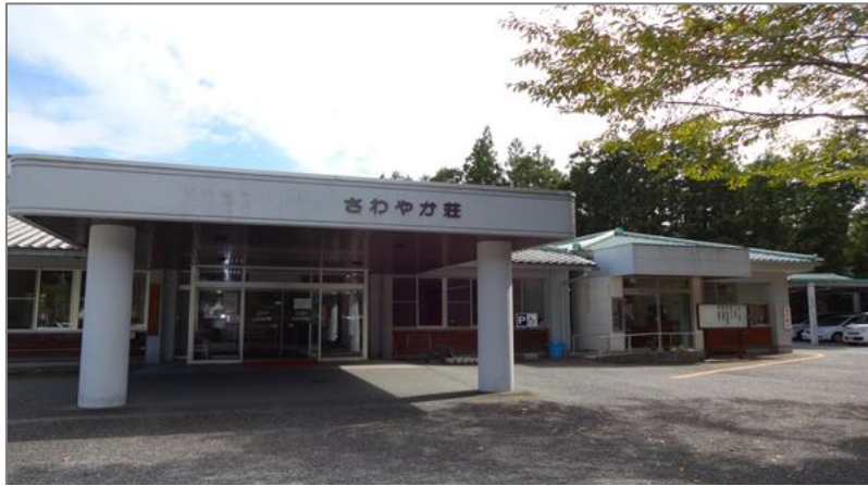
八代市泉地域福祉センター (八代市泉町下岳 2974 番地)