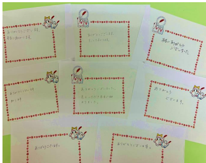
食料品セットを受け取られた皆様からのメッセージ

赤い羽根共同募金にご寄付いただきました寄付金を使わせて頂きました。 ありがとうございました。生活に困っていらっしゃる方へ支援させて頂きました。 食料品を提供させていただいた相談者の中には、仕事が決まられ、自立への一歩を 踏み出された方もいらっしゃいます。感謝いたします！