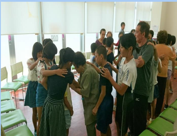
楽しいレクリエーション