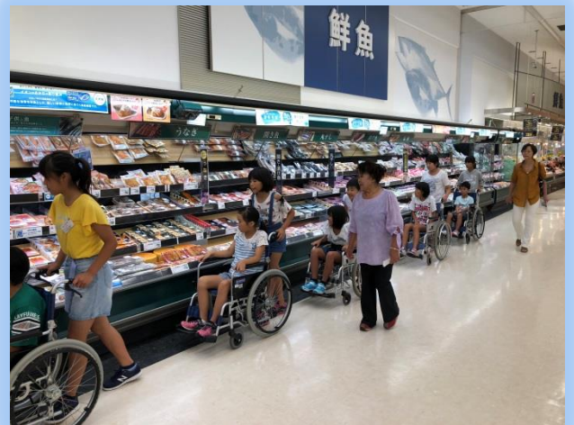
イオン内で車いす体験中！